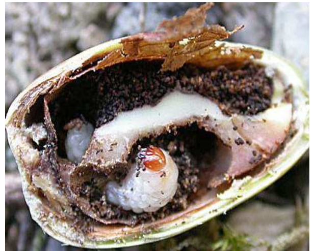
Βαλάνινος. Η προνύμφη και η ζημιά.