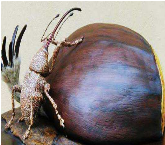
Βαλάνινος. Το σκαθάρι.