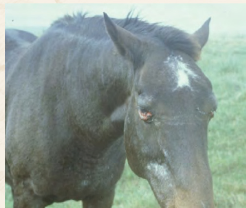
ASM Microbel Library.org Walton&Suchman

Η καρδιακή ή υποξεία μορφή έχει περίοδο επώασης 7-14 μέρες και τα κλινικά συμπτώματα αρχίζουν με ψηλό πυρετό που διαρκεί 3-6 μέρες. Χαρακτηριστικά είναι τα οίδημα που αρχικά εντοπίζονται κάτω από τα μάτια ενώ στη συνέχεια επεκτείνονται στα χείλη, τη γλώσσα και τον υπογνάθιο χώρο και πολλές φορές μέχρι το κάτω μέρος του λαιμού, στους ώμους και το θώρακα. Στο τελικό στάδιο εμφανίζεται έντονη συμφόρηση και αναστροφή του επιπεφυκότα. Το ζώο είναι ανήσυχο και μπορεί να παρουσιάσει κολικό πριν το θάνατο από ανακοπή καρδιάς. Η θνησιμότητα είναι γύρω στο 50%.