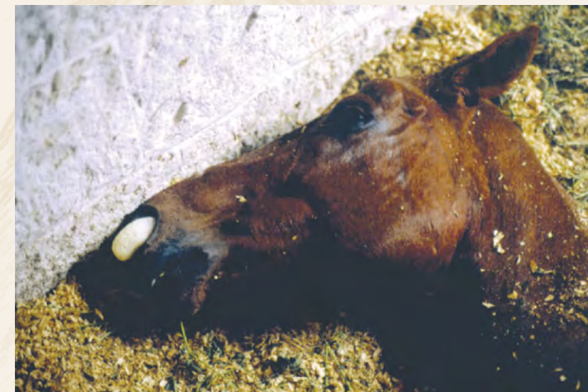
Manuel Rodriguez & Maria Castano, Madrid

Η ήπια ή υποκλινική μορφή περνά συνήθως απαρατήρητη. Η περίοδος επώασης είναι 5 με 14 μέρες και ακολουθείται από διαλείποντα πυρετό για 5 – 8 μέρες με υποχώρηση το πρωί και έξαρση το απόγευμα. Σπάνια παρατηρούνται άλλα συμπτώματα όπως ελαφριά συμφόρηση του επιπεφυκότα, αύξηση στους καρδιακούς παλμούς, ανορεξία, κατάπτωση και οίδημα κάτω από τα μάτια. Η μορφή αυτή δεν καταλήγει στο θάνατο. Παρατηρείται συνήθως σε ζώα που έχουν μερική ανοσία ή σε ανθεκτικά ζώα όπως τα γαϊδούρια και οι ζέπρες.