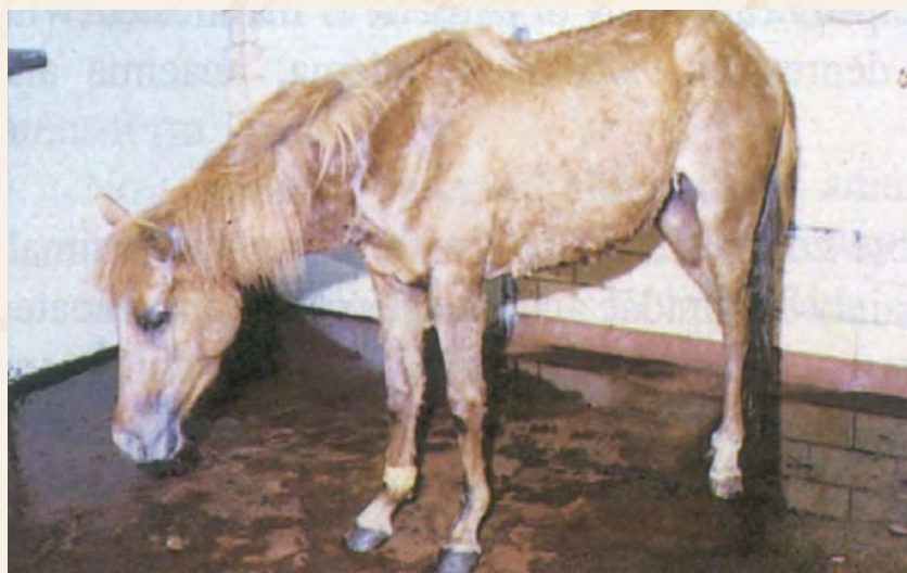
Food and Agriculture Organization

Η θνησιμότητα ποικίλει ανάλογα με το στέλεχος του ιού και το είδος του προσβαλλόμενου ζώου. Στα άλογα μπορεί να φτάσει το 90% ενώ στα γαϊδούρια, που είναι ανθεκτικά, το 10%.