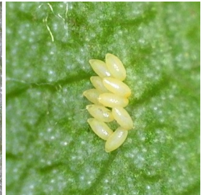
αυγά νέα-λευκά, αυγά ώριμα-κίτρινα και προνύμφη που εκκολάπτεται όπως φαίνονται από μεγέθυνση