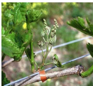
Οΐδιο: Πρώτα συμπτώματα.