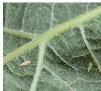
Τζιτζικάκι: Νεαρά άτομα σε φύλλο.

Πληροφορίες: Νίκος Ι. Μπαγκής – Ευάγγελος Α. Αλατσατιανός