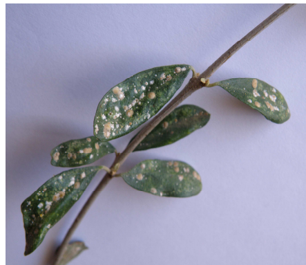
Φύλλα ελιάς προσβεβλημένα από ασπιδιωτό.