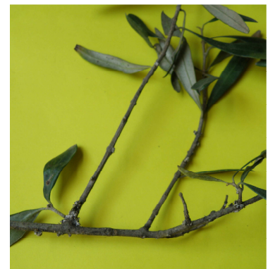
Κλαδί ελιάς με τυφλωμένους οφθαλμούς από πολλίνια. Στις μασχάλες των κλαδιών βρίσκονται τα ενήλικα.