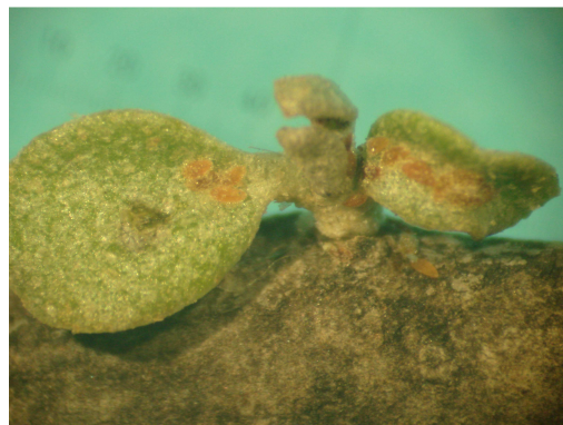
Ανώμαλη έκπτυξη οφθαλμού σε βλαστό ελιάς λόγω προσβολής από πολλίνια. Διακρίνονται οι νεαρές έρπουσες προνύμφες που είναι το ευαίσθητο στάδιο για την καταπολέμηση της νόσου.