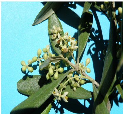
«Κρόκιασμα» ανθέων και έναρξη άνθησης στην ελιά. Φαίνονται τα φαγώματα από τις προνύμφες πυρηνοτρήτη στα κλειστά άνθη.