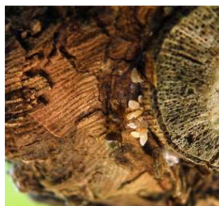
Πλανόκοκκος: Νεαρές νύμφες κάτω από το ρυτίδωμα.