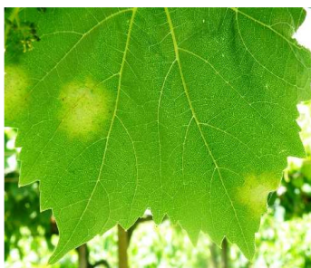
Περονόσπορος: Κηλίδες ελαίου στην πάνω επιφάνεια του φύλλου.