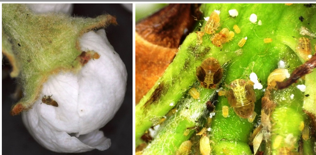
Εικόνα. Αυγά και προνύμφες Cacopsylla pyri σε ταξιανθίες