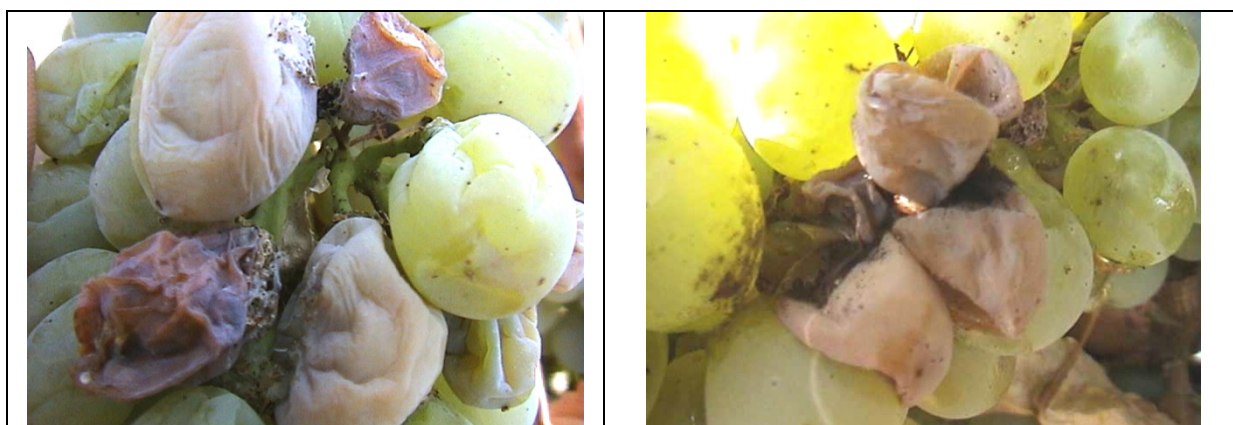
Εικόνα 1. άμεση βλάβη των ραγών από Ευδεμίδα και έμμεση βλάβη από Βοτρύτη