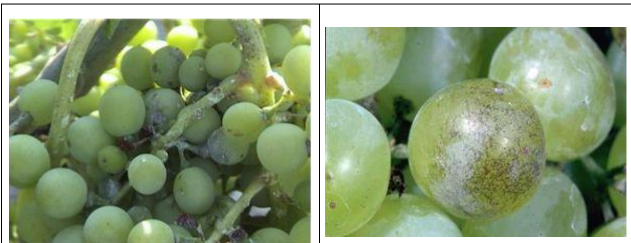
Εικόνα 3. προσβολή ωιδίου σε ράγες