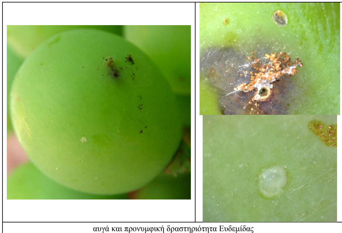
αυγά και προνυμφική δραστηριότητα Ευδεμίδας