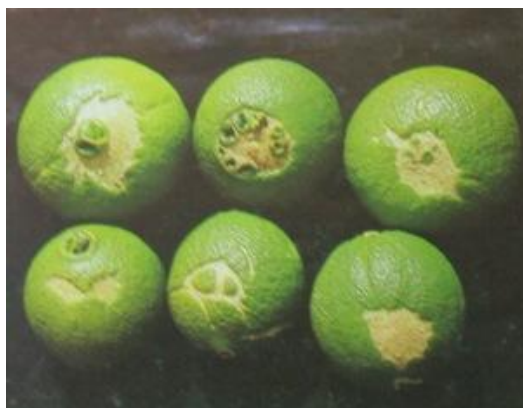
Πορτοκάλια που προσβλήθηκαν πρώιμα από θρίπες