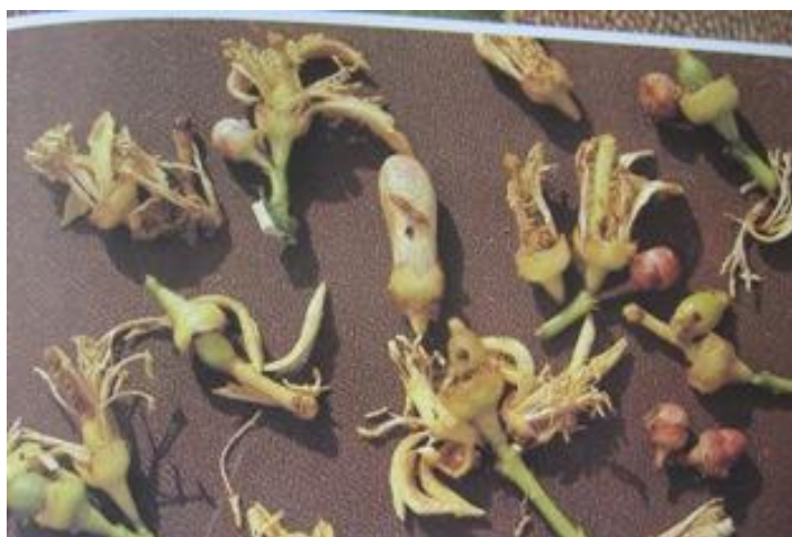
Άνθη λεμονιάς κατεστραμμένα από τον ανθοτρήτη

Διαπιστώσεις: Το έντομο προσβάλλει κυρίως τη λεμονιά ζημιώνοντας μπουμπούκια, άνθη και νεαρούς καρπούς. Οι ζημιές που προκαλούνται αυτή την εποχή δεν είναι σοβαρές και δεν έχουν ιδιαίτερη επίπτωση στην αναμενόμενη παραγωγή των δένδρων.