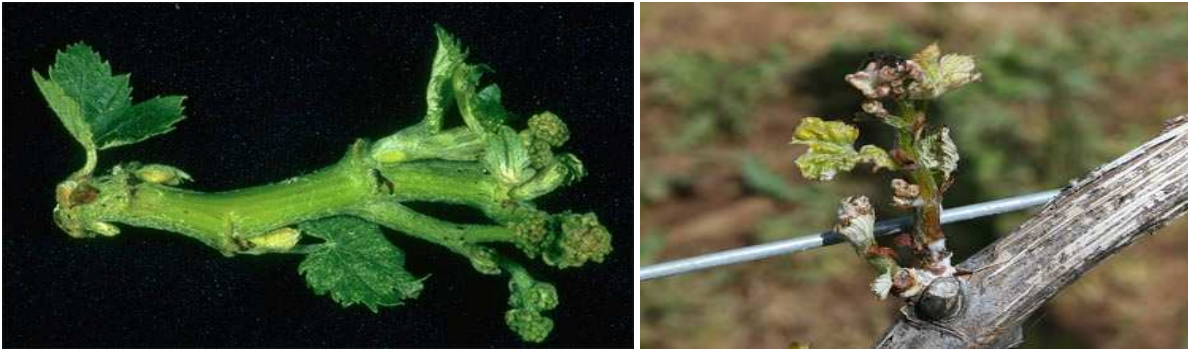
Έντονη παραμόρφωση νεαρών βλαστών από τη δράση σκωληκόμορφων ακάρεων Egiophyidae.

Καταπολέμηση συνιστάται, μόνο στην περίπτωση που έχουν διαπιστωθεί σημαντικές ζημιές (κυρίως νεκρώσεις οφθαλμών και ισχυρές παραμορφώσεις βλαστών και φυλλώματος) την προηγούμενη καλλιεργητική περίοδο. Η καταπολέμηση αφορά ψεκάσμο με βρέξιμο θείο 1% στο φούσκωμα των οφθαλμών (στάδια B1–B3 ). Μετά την έκπτυξη των οφθαλμών και για λόγους τοξικότητας, η αναλογία πρέπει να μειωθεί σε 0,8-0,6%. Ο ψεκάσμος αυτός είναι μεγάλης σημασίας, διότι οι επεμβάσεις αργότερα, μετά την εκδήλωση των συμπτωμάτων, δεν είναι υψηλής αποτελεσματικότητας.