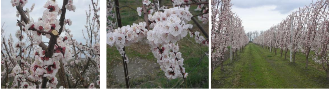
Εικ. 5,6,7 Βερικοκιές Περιοχή Χρυσούπολης (10-03-2017)