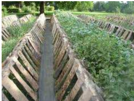
Εικόνα 3: Εκτροφείο γαλλικού τύπου

Όπως είναι αναμενόμενο όσο πιο εντατικό είναι το σύστημα εκτροφής τόσο πιο καλά μπορούν να ελεγχθούν οι παράμετροι της εκτροφής ώστε να πλησιάσουν τις βέλτιστες με στόχο την καλύτερη και ταχύτερη ανάπτυξη των σαλιγκαριών και τόσο μικρότερο ρόλο παίζουν οι περιβαλλοντικές συνθήκες της περιοχής.