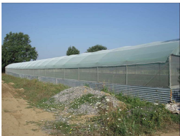
Εικόνα 2: Εκτροφείο κλειστού τύπου