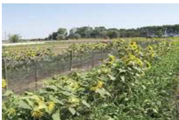
Εικόνα 1: Εκτροφείο ανοικτού τύπου