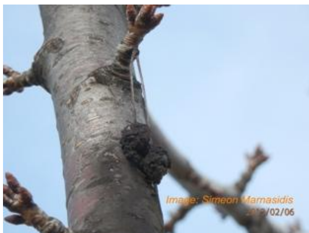
μумιοποιημένος καρπός πάνω σε δέντρο