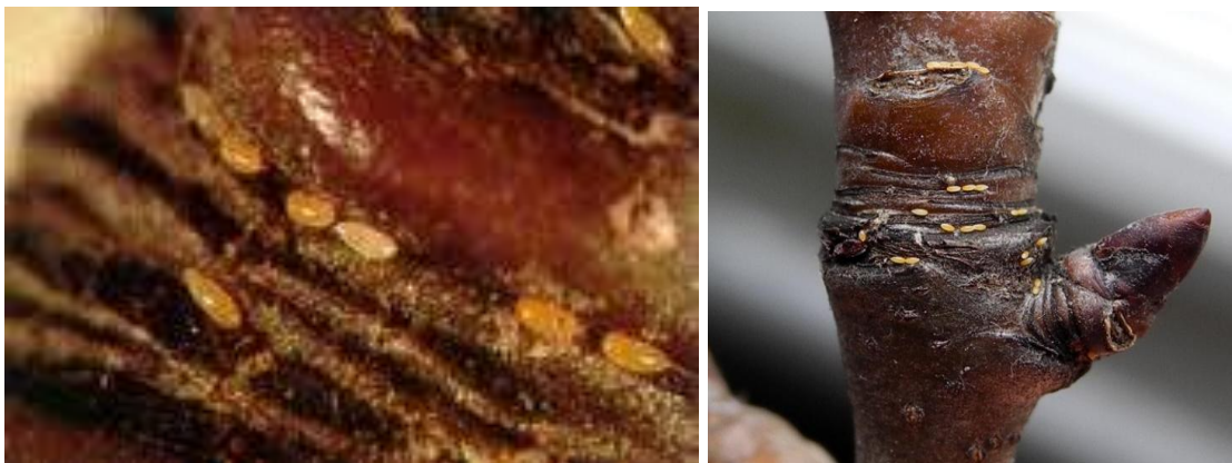
Εικ. Ωά ψύλλας ανάμεσα σε ρυτιδώματα της βάσης ανθοφόρων οφθαλμών της αχλαδιάς.

Λίγο αργότερα και κατά τη βλαστική περίοδο, οι λαίμαργοι βλαστοί πρέπει να απομακρύνονται με το χέρι όταν είναι ακόμη τρυφεροί, διότι συγκεντρώνουν μεγάλο πληθυσμό του εντόμου.