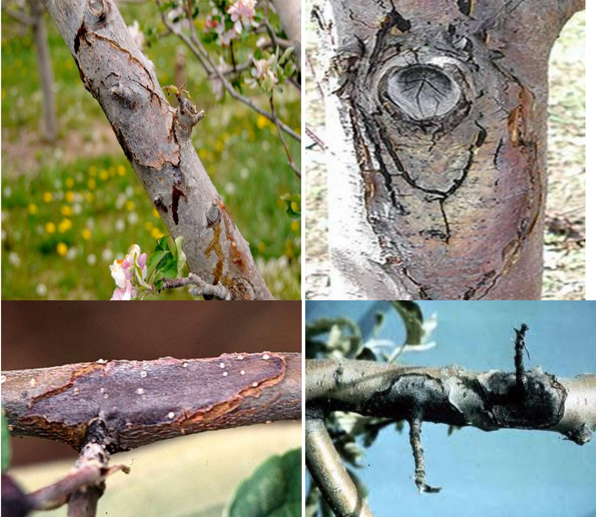
Εικ. Χαρακτηριστικές προσβολές (έλκη) του βακτηρίου στον κορμό και σε κλάδους

Προσοχή: Σε κάθε περίπτωση να τηρούνται αυστηρά οι οδηγίες χρήσης των φυτοπροστατευτικών προϊόντων για την αναλογία χρήσης, την συνδυαστικότητα, τον κίνδυνο φυτοτοξικότητας, το διάστημα μεταξύ τελευταίας επέμβασης και συγκομιδής και τα μέτρα προστασίας για την αποφυγή δηλητηρίασης.