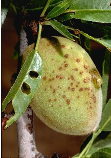
Εικόνα 2 Συμπτώματα κορύνεου σε φύλλα (τρύπες από σκάγια), βλαστό και καρπό

ΣΥΣΤΑΣΕΙΣ: Συνιστώνται ψεκασμοί για τις περιοχές που τα δένδρα βρίσκονται στο τελικό στάδιο της διόγκωσης των οφθαλμών και επανάληψή τους μετά την πτώση των πετάλων, με κατάλληλα και εγκεκριμένα φυτοπροστατευτικά προϊόντα.