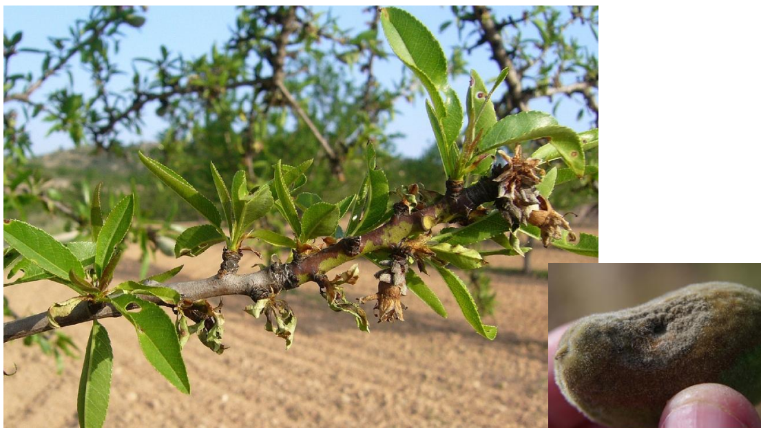
Εικόνα 1 Συμπτώματα μονιλίας σε βλαστό και καρπό αμυγδαλιάς

Φυτοπροστατευτικά προϊόντα: Captan, iprodione, και άλλα επιτρεπόμενα σκευάσματα.