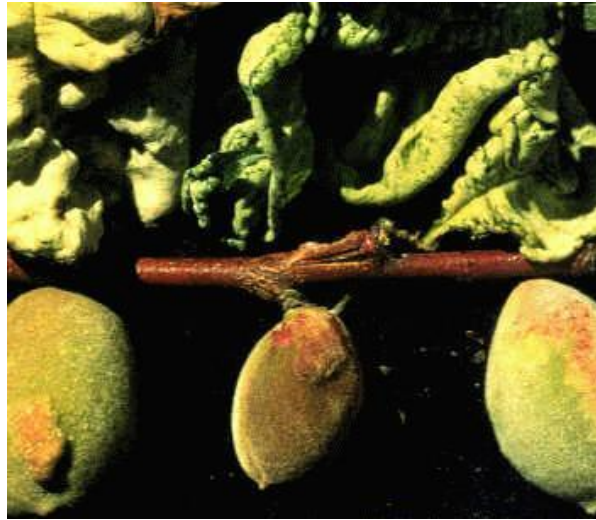
Εικόνα 3 Συμπτώματα εξώασκου σε φύλλα και καρπούς αμυγδαλιάς