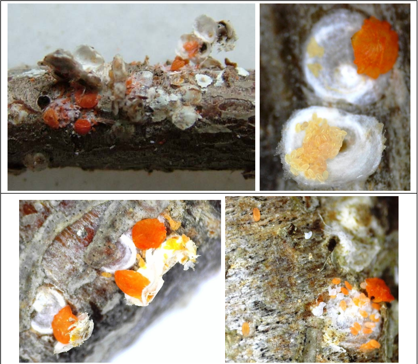
Ζωντανά θηλυκά, παρασιτισμένα θηλυκά, αυγά, έρπουσες

Με τις προτεινόμενες δειγματοληψίες ο παραγωγός έχει τη δυνατότητα να γνωρίζει τόσο εάν είναι απαραίτητη οποιαδήποτε επέμβαση καθώς και τον κατάλληλο χρόνο διενέργειάς της