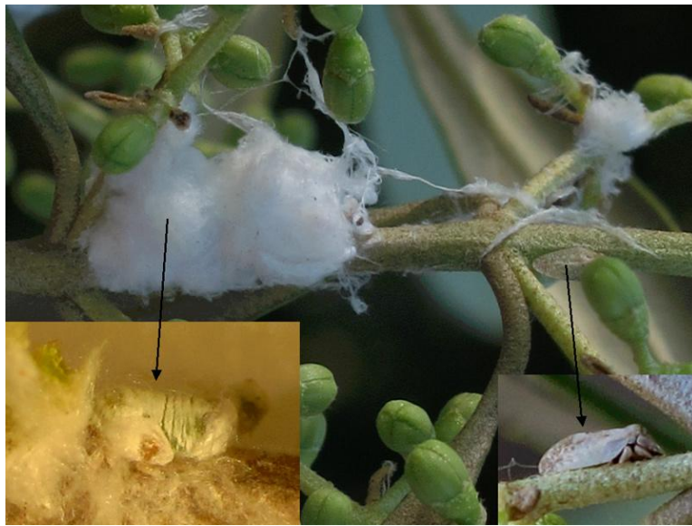
Εικόνα 3 Αποικία ψύλλας ελιάς (βαμβακάδας) σε ταξιανθία του δένδρου