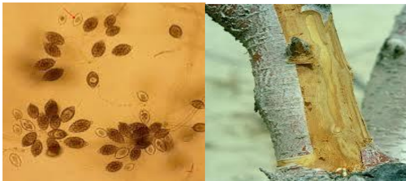
Εικ.5-Προσβολή από φυτόφθορα

Ο μύκητας μεταδίδεται από το έδαφος στο λαιμό του δένδρου και ευνοείται από την ύπαρξη τραυμάτων στο σημείο εμβολιασμού ή στις ρίζες των δένδρων. Η ζημιά εκδηλώνεται αργά την άνοιξη την εποχή της έναρξης της βλάστησης. Τα δένδρα σταματούν να βλαστάνουν τα φύλλα τους γίνονται μικρά χλωρωτικά και προοδευτικά παρατηρούνται ξηράνσεις κλάδων, βλαστών και όταν είναι μικρά ξηραίνονται. Η ασθένεια ευνοείται από την υψηλή υγρασία που ενδέχεται να υπάρχει κοντά στο λαιμό του δένδρου.