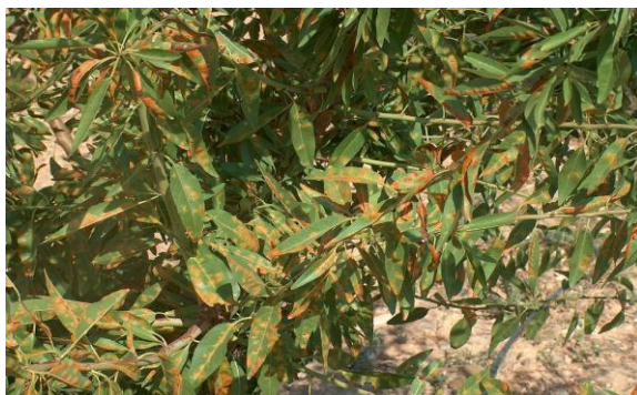
Εικόνα 4 - Πολυστίγμωση

ΣΥΝΘΗΚΕΣ ΑΝΑΠΤΥΞΗΣ-ΣΥΜΠΤΩΜΑΤΑ: Υγρός και βροχερός καιρός είναι απαραίτητος για την πραγματοποίηση των μολύνσεων. Τα φύλλα είναι ευπαθή στις μολύνσεις καθόλη την βλαστική περίοδο.