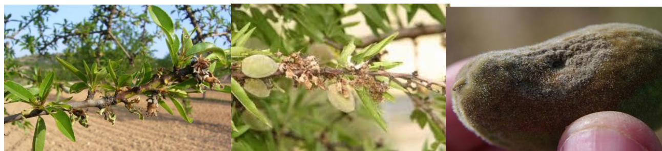
Εικόνα 1 Συμπτώματα μονιλίας σε βλαστούς και καρπό αμυγδαλιάς

Αποτελεί μεγάλης οικονομικής σημασίας ασθένεια της Αμυγδαλιάς. Η είσοδος του παθογόνου στο δένδρο γίνεται από οποιοδήποτε μέρος του άνθους και από τους καρπούς. Ο μύκητας διαχειμάζει στα έλκη, στους μουμιοποιημένους καρπούς και στους αποξηραμένους κλάδους.