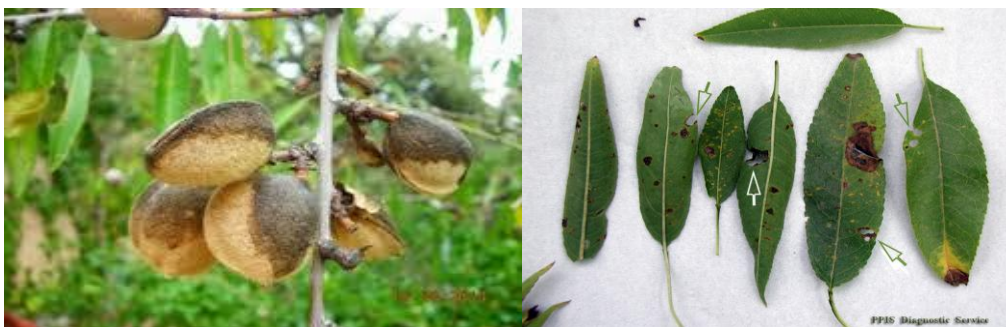
Εικόνα 6-Προσβολή από Ανθράκωση