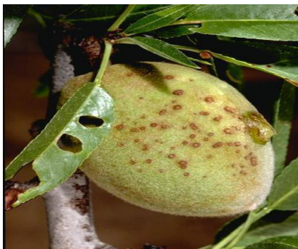
Εικόνα 3 Συμπτώματα κορύνεου σε φύλλα (τρύπες από σκάγια), βλαστό και καρπό