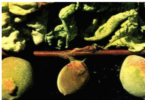
Εικόνα 2 Συμπτώματα εξώασκου σε φύλλα και καρπούς αμυγδαλιάς

Μυκητολογικές ασθένειες που προσβάλλουν τα φύλλα, τα άνθη και στη συνέχεια και τους καρπούς.