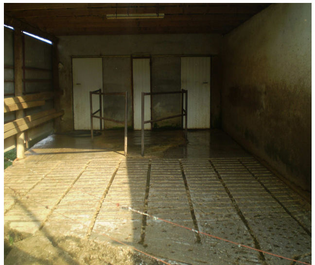
Εικόνα 27: Χώρος Αναμονής