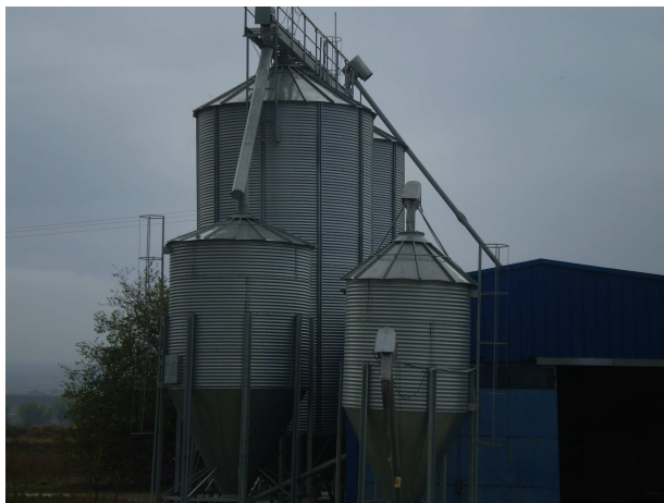
Εικόνα 7: Σιλό