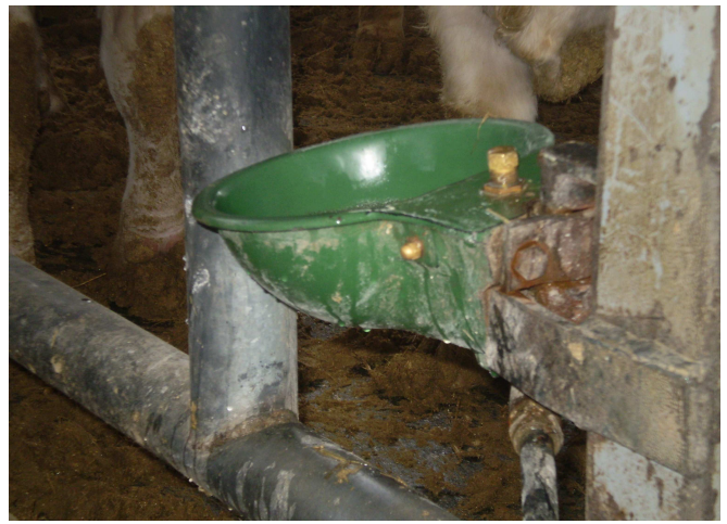
Εικόνα 4: Μεταλλικές αυτόματες ποτίστρες