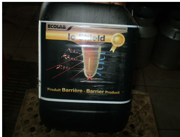
Εικόνα 30: Ειδικό διάλυμα για την προστασία των θηλών

Αξίζει να σημειωθεί ότι τηρούνται όλοι βασικοί κανόνες αρμέγματος και γίνονται όλες οι προκαταρκτικές εργασίες, δηλαδή πλύσιμο των θηλών με ειδικό απολυμαντικό διάλυμα, στέγνωμα του μαστού με χαρτί μιας χρήσεως, γίνεται έλεγχος της υγιεινής κατάστασης του γάλακτος, οι πρώτες σταγόνες γάλακτος από κάθε θηλή μαζεύονται σε ένα σκεύος και ελέγχονται για ύπαρξη πηγμάτων γάλακτος που θα σήμαινε ύπαρξη μαστίτιδας. Μετά το τέλος του αρμέγματος οι θηλές σκουπίζονται και εμβαπτίζονται σε ένα ειδικό διάλυμα που αφήνει μια μεμβράνη πάνω στη θηλή για να μην μολυνθούν από μικρόβια.