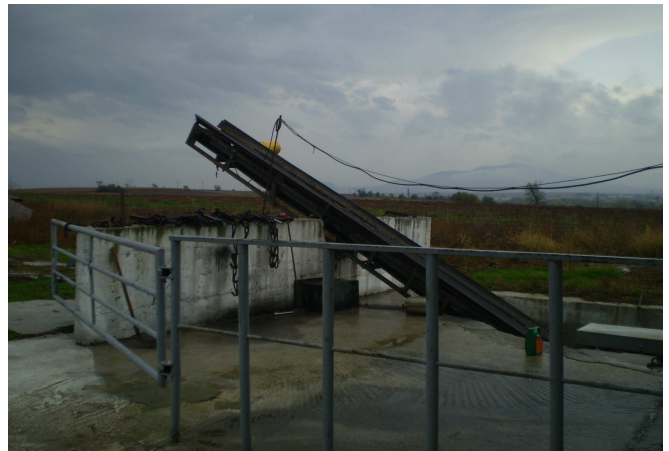
Εικόνα 6: Ταινιόδρομος