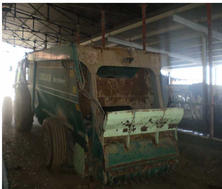
Εικόνα 19: Ενσιρωδιανομέας