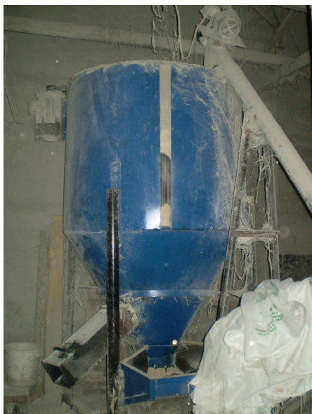
Εικόνα 12: Χαρμανιέρα