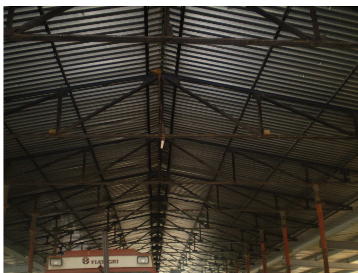
Εικόνα 16: Στέγαστρο