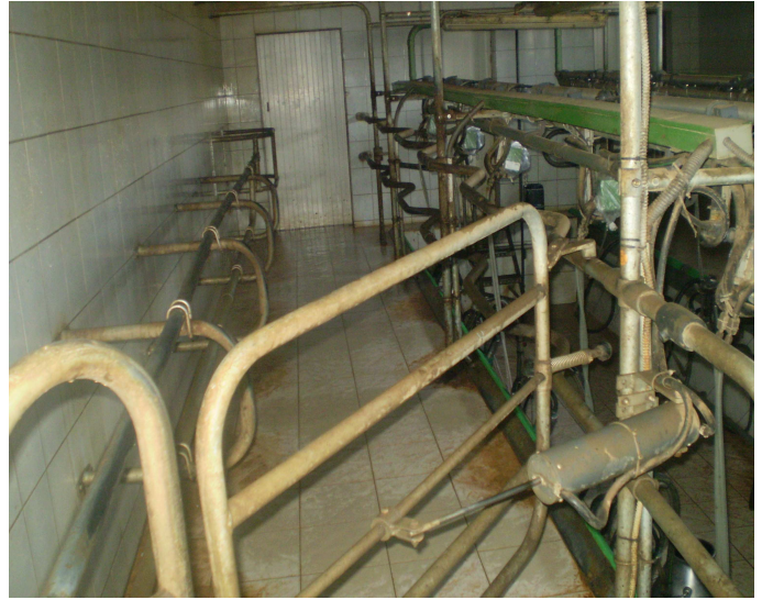
Εικόνες 24-25: Αμελκτήριο