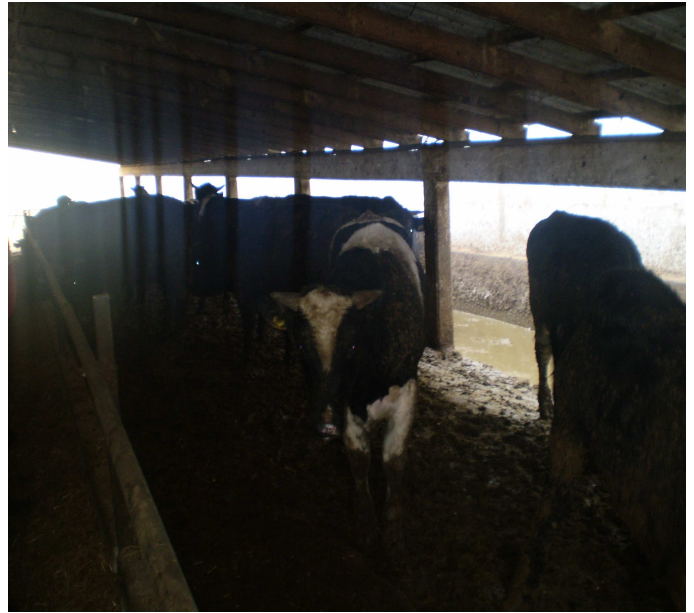
Εικόνες 20-21: Στάβλος Πάχυνσης