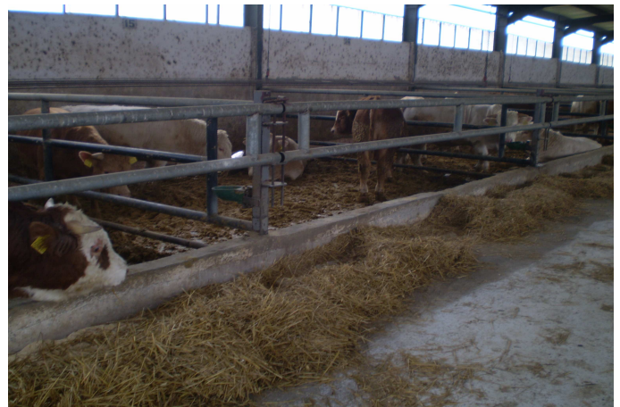
Εικόνες 1,2: Διάδρομος κυκλοφορίας- τροφοδοσίας- κελιά