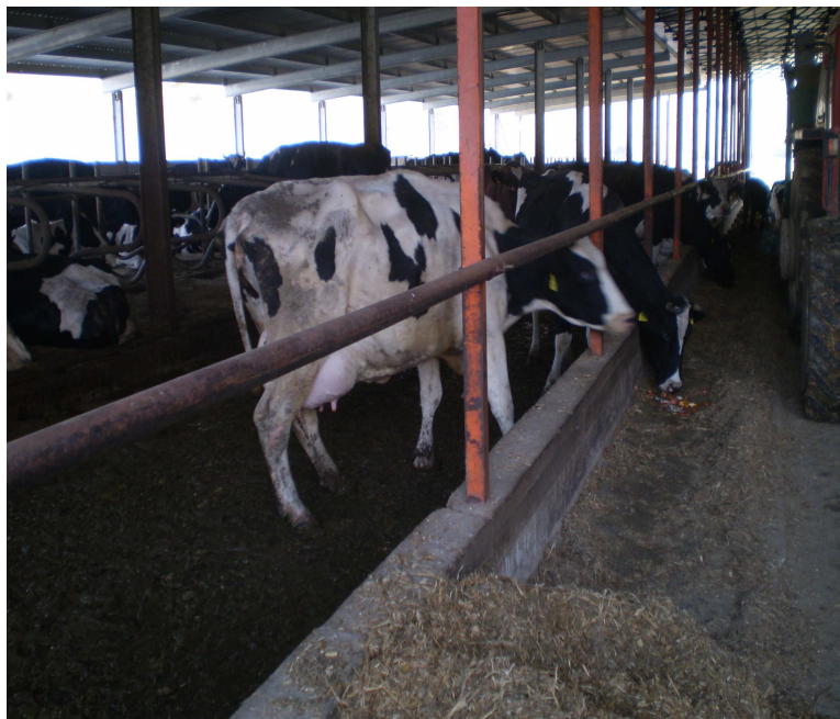
Εικόνα 18: Διάδρομος τροφοδοσίας