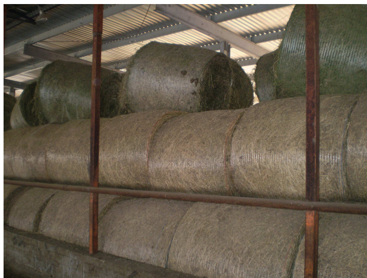
Εικόνα 29: Τριφύλλι