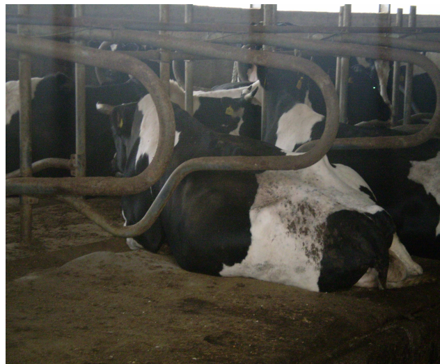
Εικόνα 14-15: Θέσεις Ανάπαυσης