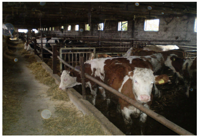
Εικόνα 9: Διάδρομος κυκλοφορίας- τροφοδοσίας- κελιά