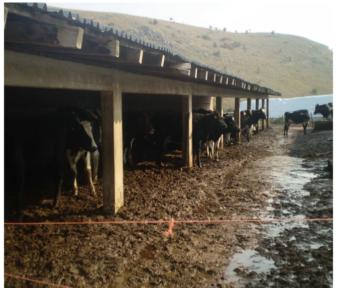
Εικόνες 22-23: Στάβλος αγελάδων σε ξηρά περίοδο