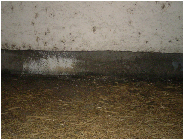
Εικόνα 5: Αυλάκι μέσα στο οποίο υπάρχει ταινιόδρομος που μεταφέρει έξω την κοπριά.