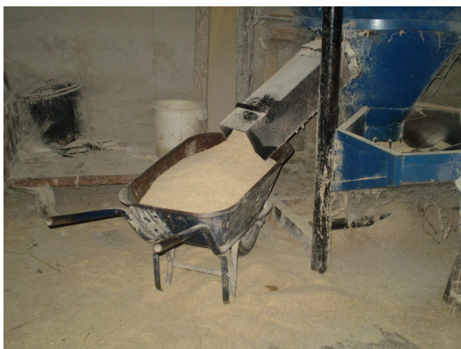
Εικόνα 13: Μίγμα Συμπυκνωμένων ζωοτροφών

Επιτυγχάνεται Μέση Αύξηση Ζ.Β. μηνιαίως 15-20κιλά εξαρτάται βέβαια από την ηλικία και τη φυλή του κάθε ζώου.