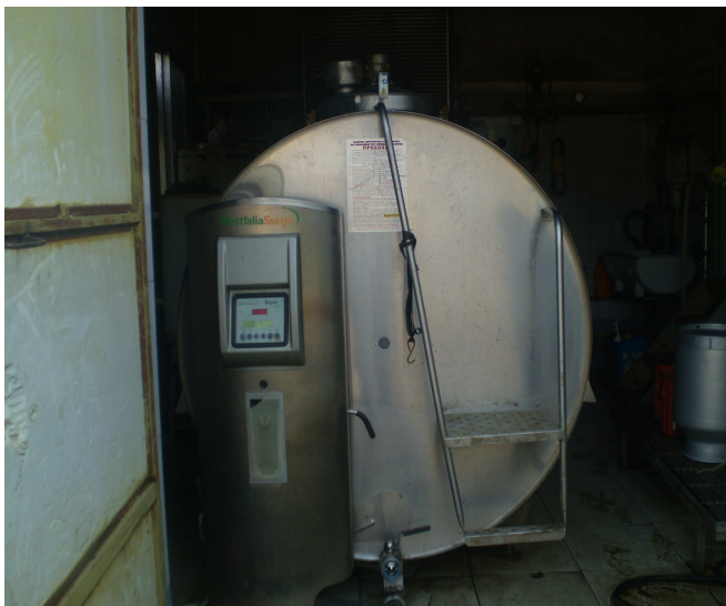
Εικόνα 26: Παγολεκάνη