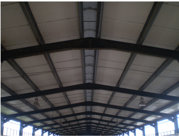
Εικόνα 3: Η στέγη της μονάδας φτιαγμένη από σιδεροκολώνες και πανελ.