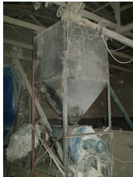
Εικόνα 11: Σπαστήρας