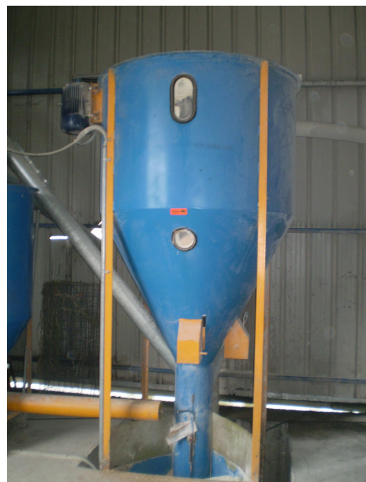
Εικόνα 8: Χαρμανιέρα