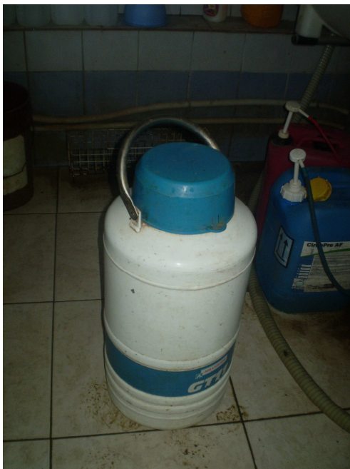
Εικόνα 28: Τράπεζα Σπέρματος

Η μονάδα είναι μικτής κατεύθυνσης. Οι φυλές που εκτρέφονται είναι Χολστάιν και Λιμουζίν. Η αναπαραγωγή γίνεται με τεχνητή σπερματέχυνση που την εφαρμόζουν οι ίδιοι. Σε θηλυκό Χολστάιν γίνεται τεχνητή σπερματέχυνση με σπέρμα από ταύρο της φυλής Λιμουζίν. Αν το μοσχάρι γεννηθεί θηλυκό Χολστάιν μένει στη μονάδα για γαλακτοπαραγωγή. Αν γεννηθεί αρσενικό είτε Χολστάιν είτε Λιμουζίν τότε πάει για πάχυνση και στην ηλικία 13-17 μηνών (ανάλογα τη φυλή) σφάζονται.