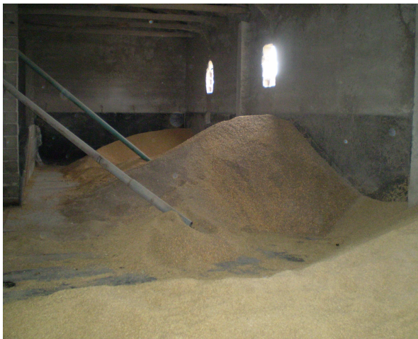
Εικόνα 10: Ζωοτροφές (Καλαμπόκι, Κριθάρι)