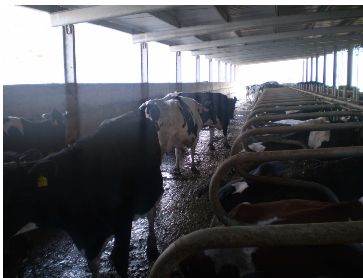
Εικόνα 17: Διάδρομος κυκλοφορίας- Θέσεις Ανάπαυσης