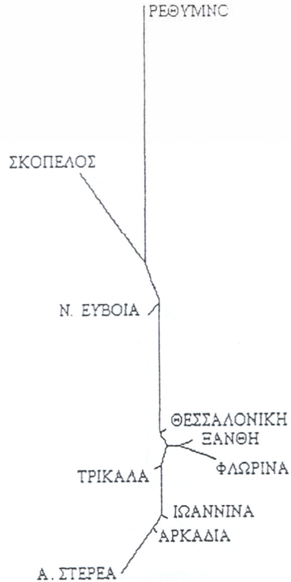
Σχήμα 8 : Δενδρόγραμμα χωρίς ρίζα, που προκύπτει από την εφαρμογή της μεθόδου Neighbor-Joining και των αποστάσεων μεταξύ των περιοχών.