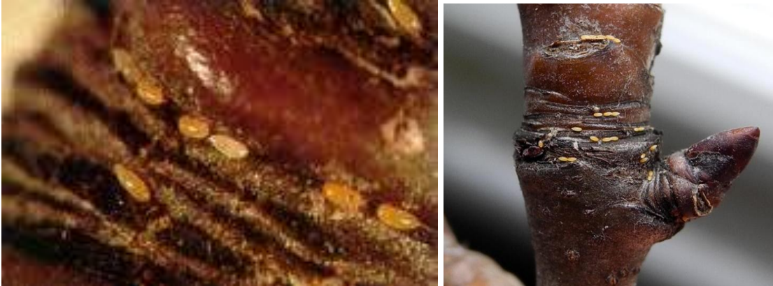
Εικ. Ωά ψύλλας ανάμεσα σε ρυτιδώματα της βάσης ανθοφόρων οφθαλμών της αχλαδιάς.

Λίγο αργότερα και κατά τη βλαστική περίοδο, οι λαίμαργοι βλαστοί πρέπει να απομακρύνονται με το χέρι όταν είναι ακόμη τρυφεροί, διότι συγκεντρώνουν μεγάλο πληθυσμό του εντόμου.