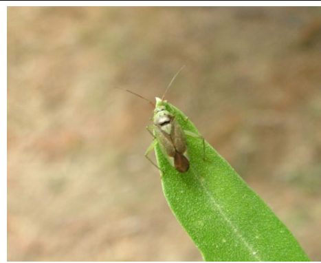
ΚΑΛΟΚΟΡΗ ( Calocoris trivialis )