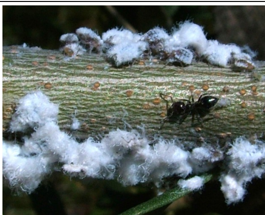
ΒΑΜΒΑΚΑΔΑ ( Euphyllura phillyreae )