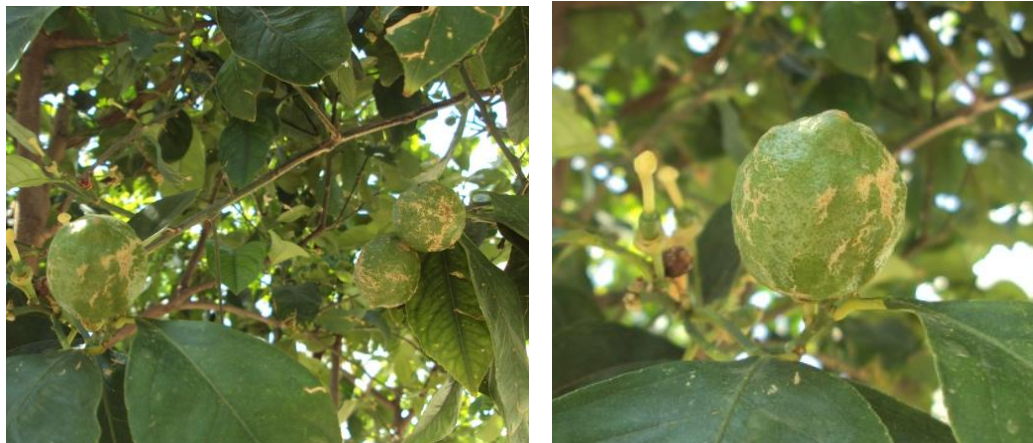
Λεμόνια προσβεβλημένα από Θρίπες