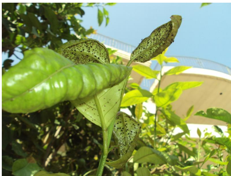
Μαύρη αφίδα σε δέντρο λεμονιάς

Συστάσεις: Στα δένδροκομεία που διαπιστώνονται τα έντομα να γίνει καταπολέμηση.