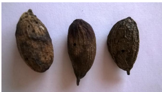
Εικ. 2. Μουμιοποιημένοι καρποί φιστικιάς.

Ένα ποσοστό των καρπών αυτών καλό είναι να ελέγχεται για την παρουσία προνυμφών στο εσωτερικό τους, ώστε να τοποθετηθούν σε πλαστικά ή γυάλινα διαφανή δοχεία την ερχόμενη άνοιξη, για τον ακριβή προσδιορισμό της εξόδου του εντόμου και την αποφυγή άσκοπων ψεκασμών πριν την εμφάνισή του.