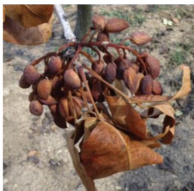
Εικ. 1. Ταξικαρπία προσβεβλημένη από βοτρυοσφαίρια.

Συστήνεται συλλογή και καταστροφή των προσβεβλημένων από βοτρυοσφαίρια ταξικαρπιών της περσινής περιόδου (εικ. 1), καθώς και των αντίστοιχων κλάδων που τις φέρουν. Τα προσβεβλημένα όργανα που απομένουν πάνω στα δένδρα αποτελούν την κύρια πηγή μόλυσματος για τις πρωτογενείς μολύνσεις την ερχόμενη άνοιξη.