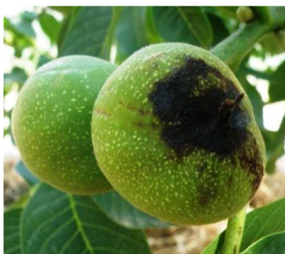
Προσβολή σε καρπό. Η μόλυνση ξεκίνησε από το στίγμα.