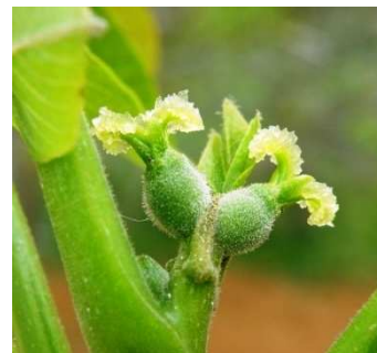
E Άνθηση θηλυκών ανθέων