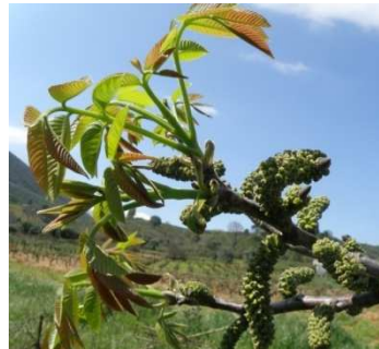
D Τούλοι (αρσενικά άνθη)