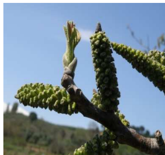
B Έναρξη βλάστησης