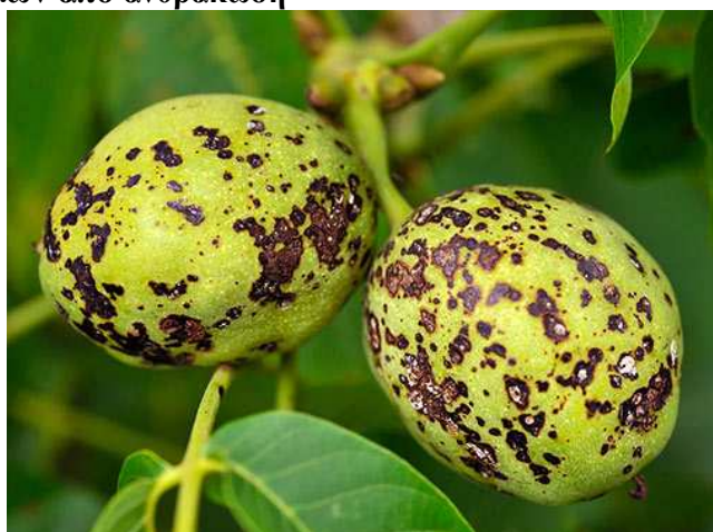
Προσβολές σε καρπούς.