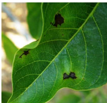
Κηλίδες σε φύλλο.