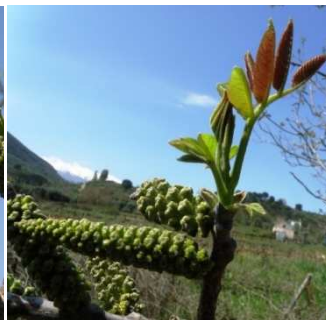
C Πρώτα φύλλα & ίουλοι