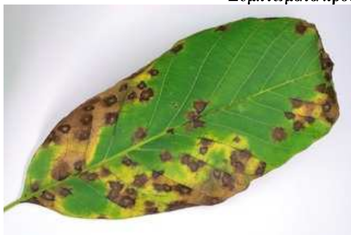
Προσβολές σε φύλλο.