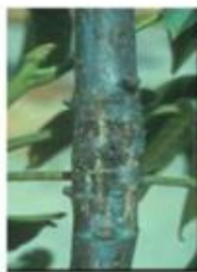
Προσβολή σε νεαρό βλαστό.