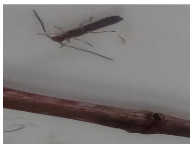
Ακμαίο και χαρακτηριστική δακτυλιοειδής προσβολή.

Την συγκεκριμένη περίοδο σε πολλούς καρυδεώνες παρατηρούνται ξηράνσεις κλάδων, λόγω της αστοχίας έκπτυξης, που οφείλονται στο έντομο Oberea linearis (βλ. εικόνα). Για το λόγο αυτό θα πρέπει να καταβάλλεται κάθε δυνατή προσπάθεια καθαρισμού με κλαδέματα των προσβεβλημένων βλαστών και καταστροφής τους με φωτιά. Σε επόμενο δελτίο θα γίνει αναλυτική αναφορά στον συγκεκριμένο εχθρό.