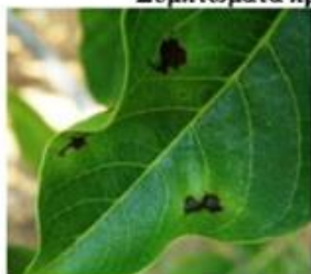
Κηλίδες σε φύλλο.