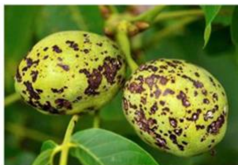
Ανυρακωση. Προσβολές σε καρπούς.