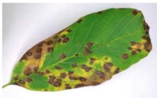
Ανυρακωση. Προσβολές σε φύλλο.