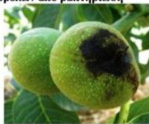
Προσβολή σε ανεπτυγμένο καρπό.