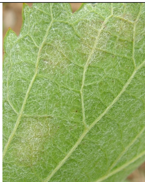
επάνθιση (καρποφορία του μύκητα) στην κάτω επιφάνεια του φύλλου