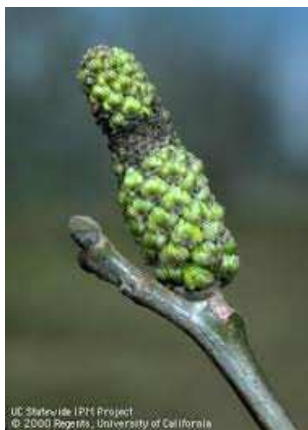
Εικ. 1 & 2. Προσβολή ίουλων