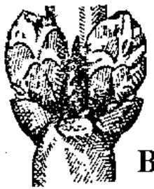
Έναρξη διόγκωσης οφθαλμών