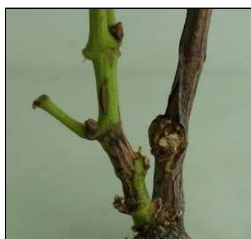
Φόμοψη . Προσβεβλημένη κλιματίδα (δεξιά) και μόλυνση νεαρού βλαστού την άνοιξη (αριστερά).