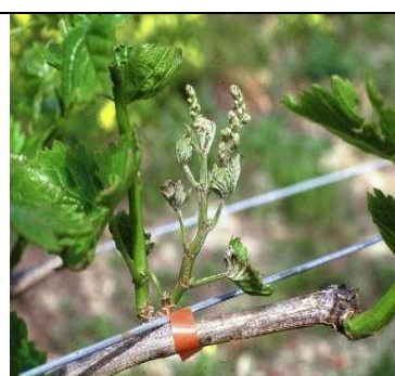
Ωίδιο . Πρώιμες προσβολές.