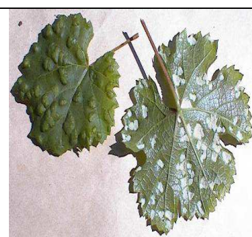
Ερίνωση . Εξογκώματα στην πάνω και κοιλότητες με λευκές εριώδεις τρίχες στην κάτω επιφάνεια φύλλου.

ΠΑΡΑΤΗΡΗΣΗ : Δεν επιτρέπεται η συγκομιδή αμπελόφυλλων από αμπελώνες στους οποίους έχει γίνει χρήση φυτοπροστατευτικών προϊόντων.