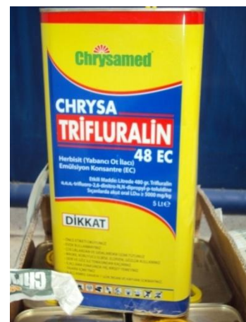
Σκεύασμα με δραστική ουσία trifluralin, προέλευσης Τουρκίας που βρέθηκε σε επιτόπιο έλεγχο σε αποθήκη παραγωγού

Επιπλέον στις περιπτώσεις όπου η προέλευση του σκευάσματος είναι εκτός Ε.Ε., ο ελεγκτής που διαπιστώνει την παράβαση οφείλει να ενημερώσει άμεσα τις τελωνειακές αρχές για να ελεγχθεί αν έχουν καταβληθεί οι σχετικοί δασμοί (Δίωξη Λαθρεμπορίου).