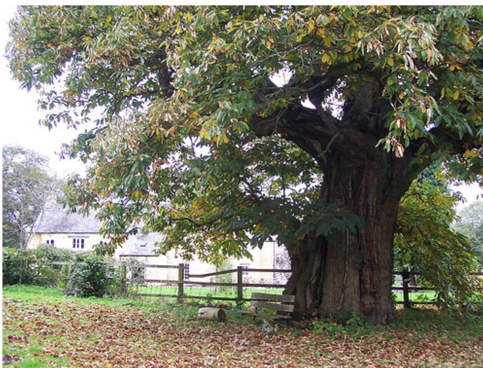
Εικόνα 1. Η διάμετρος του κορμού (Castanea sativa)

Το δέντρο της καστανιάς μπορεί να φτάσει έως τα 25-30 μέτρα ύψος ενώ ο κορμός του αυξάνει έως 2 μέτρα πλάτος (εικόνα 1). Όταν είναι μεμονωμένο, έχοντας αρκετό χώρο για να αναπτυχθεί παίρνει τεράστιες διαστάσεις, δημιουργεί χοντρούς βραχίονες και παίρνει σχήμα σφαιρικό. Όταν βρίσκεται σε συστάδες δέντρων, όπου ο χώρος είναι περιορισμένος, αυξάνει σε ύψος και παίρνει πυραμοειδές σχήμα. Αν βέβαια έχει δεχτεί κλάδεμα διαμόρφωσης τα πρώτα χρόνια της ηλικίας του, τότε το σχήμα του διαμορφώνεται σε ένα ανοιχτό κυπελλοειδές με τα κλαδιά να πέφτουν προς την γη (κλαίουσα μορφή).