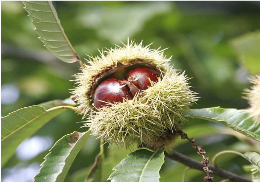
Εικόνα 4. Το ακανθώδες περίβλημα (ο αχινός) που περιβάλλει τα κάστανα