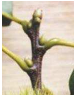
Εικόνα 2. Ετήσιος βλαστός. ( www.acf.org/Tree ID Files_Sisco/eustem.html )

Οι βλαστοί είναι ευθείς και εύκαμπτοι. Όταν είναι ακόμη τρυφεροί, παρουσιάζουν ιδιαίτερη ευαισθησία στους δυνατούς ανέμους. Έχουν πράσινο χρώμα, ενώ όταν ξυλοποιηθούν αποκτούν καστανοκίτρινο (εικόνα 2). Οι ώριμοι βλαστοί γίνονται γωνιώδεις, με πέντε κύριες γωνίες (Δημουλάς, 1986).