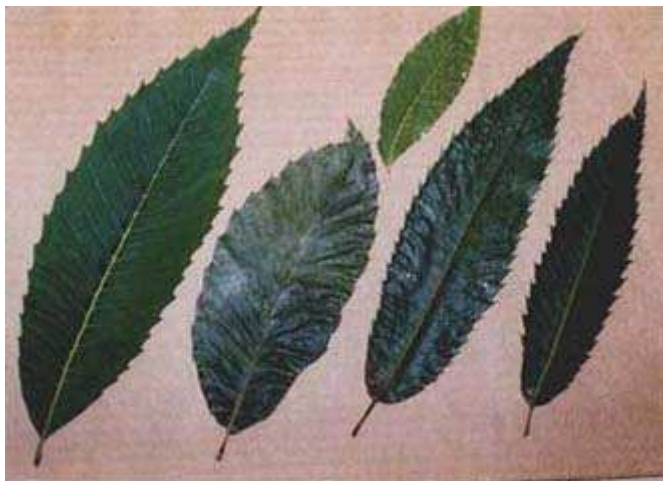
Εικόνα 3. Διαφορές στα φύλλα της καστανιάς σε συνάρτηση με το είδος. Από τα αριστερά προς τα δεξιά ( C. dentata , C. mollissima , C. sativa , C. crenata ). ( www.acf.org/Tree ID Files_Sisco/eustem.html )

Τα φύλλα είναι απλά, λογχοειδή με πριονωτές παρυφές και μυτερές κορυφές. Η βάση των φύλλων είναι υποστρόγγυλη και φέρουν κοντό μίσχο. Το μήκος τους κυμαίνεται από 12-20 εκ., ενώ το πλάτος από 3-6 εκ. (εικόνα 3). Τα φύλλα του φέρονται κατ'εναλλαγή (Δημουλάς, 1986).