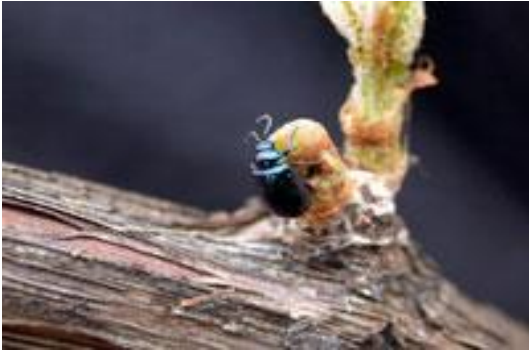
Ακμαίο κολεόπτερο Altica spp. τρεφόμενο σε εκπτυσσόμενους οφθαλμούς.

Την περίοδο αυτή, συνιστάται ο συχνός έλεγχος των πρέμων και συγκεκριμένα των κεφαλών, για την ύπαρξη φαγωμένων οφθαλμών, καθώς και για την παρουσία προνυμφών. Σε περίπτωση προσβολής, ανάλογος έλεγχος συνιστάται και κατά τη διάρκεια της νύκτας, για τη διαπίστωση της παρουσίας και της δραστηριότητας ακμαίων (σκαθαριών) ωτιορρύγχων. Σημειώνεται, ότι οι ωτιόρρυγχοι δραστηριοποιούνται τις νυκτερινές ώρες. Σε περίπτωση που υπήρξε προσβολή των οφθαλμών την προηγούμενη χρονιά, ο έλεγχος αυτή την κρίσιμη περίοδο, θα πρέπει να διενεργείται τουλάχιστον δύο φορές την εβδομάδα.